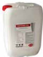
Kanne à 20 kg

Anwendung: Als Starthilfe nach dem Abkalben, bei Schlaptheit, Fressunlust und Leistungsabfall 400 – 800 g pro Tag, eine Woche vor und bis fünf Wochen nach der Abkalbung