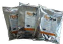
Karton à 12 Portionenbeutel

Anwendung: 150 - 200 ml pro Tag, ab einer Woche vor dem Abkalbetermin unter das Kraftfutter oder das Grundfutter mischen.