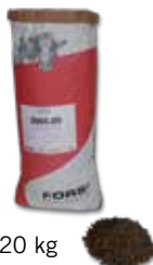
Sack à 20 kg

Anwendung: 700 g First Drink (1 Beutel) in 20 Liter handwarmem Wasser (25 – 30° C) auflösen und der Kuh direkt nach dem Kalben zum Trinken anbieten